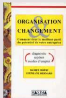
Organisation & Changement

Une vision de l'Organisation, système en transformation perpétuelle, jusqu'à « l'approche de la complexité » ... (en passant par l'innovation et ses « invariants » )