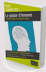
Le plaisir d'innover